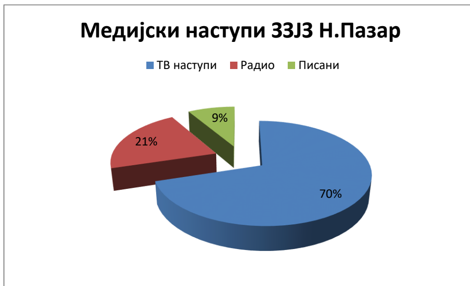
Графикон бр.2-Медијски наступи ЗЗЈЗ Н.Пазар

У 2016.години одржане су 94 едукације што је просечно 4,7 едукација по запосленом здравственом раднику/сараднику (графикон бр.3).