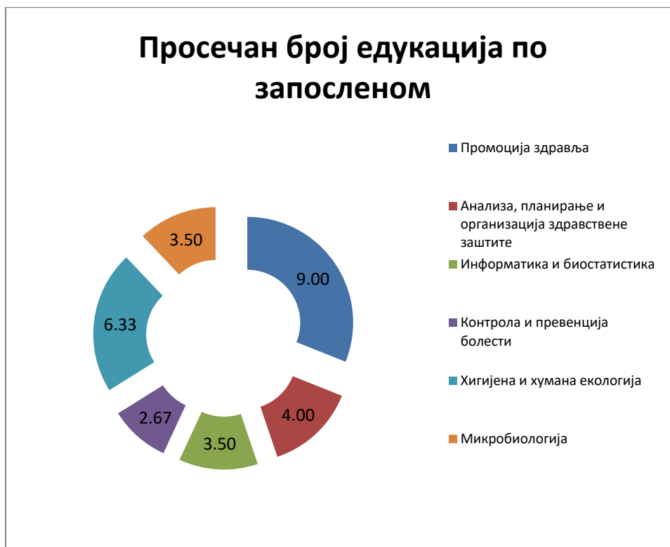
Графикон бр.3-Просечан број едукација по запосленом у Заводу за јавно здравље Н.Пазар у 2016.години

У 2016.години одржане су 94 едукације што је просечно 4,7 едукација по запосленом здравственом раднику/сараднику (графикон бр.3).