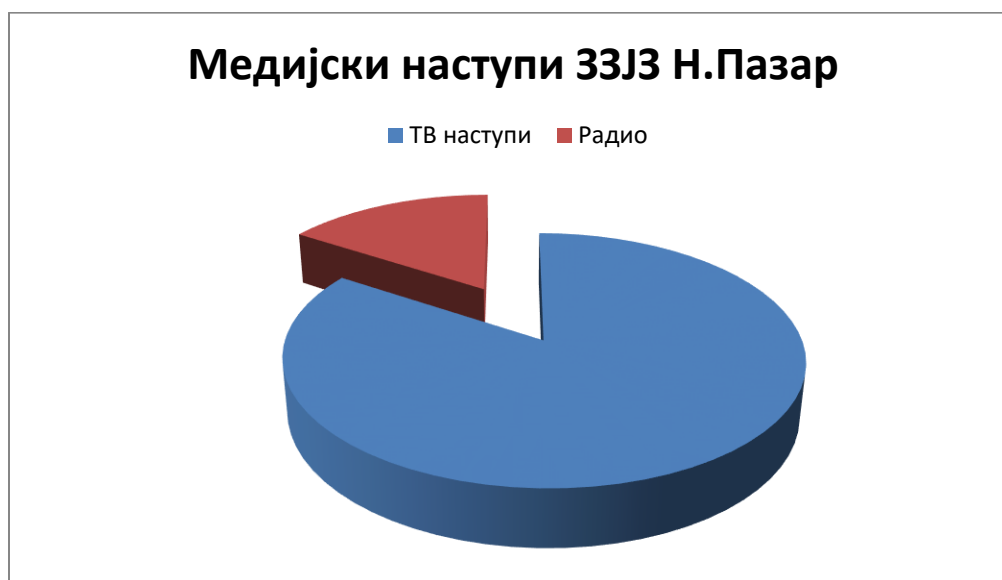
Графикон бр.2-Медијски наступи ЗЗЈЗ Н.Пазар

У 2017.години одржане су 98 едукације што је просечно 4,08 едукација по запосленом здравственом раднику/сараднику (графикон бр.3).