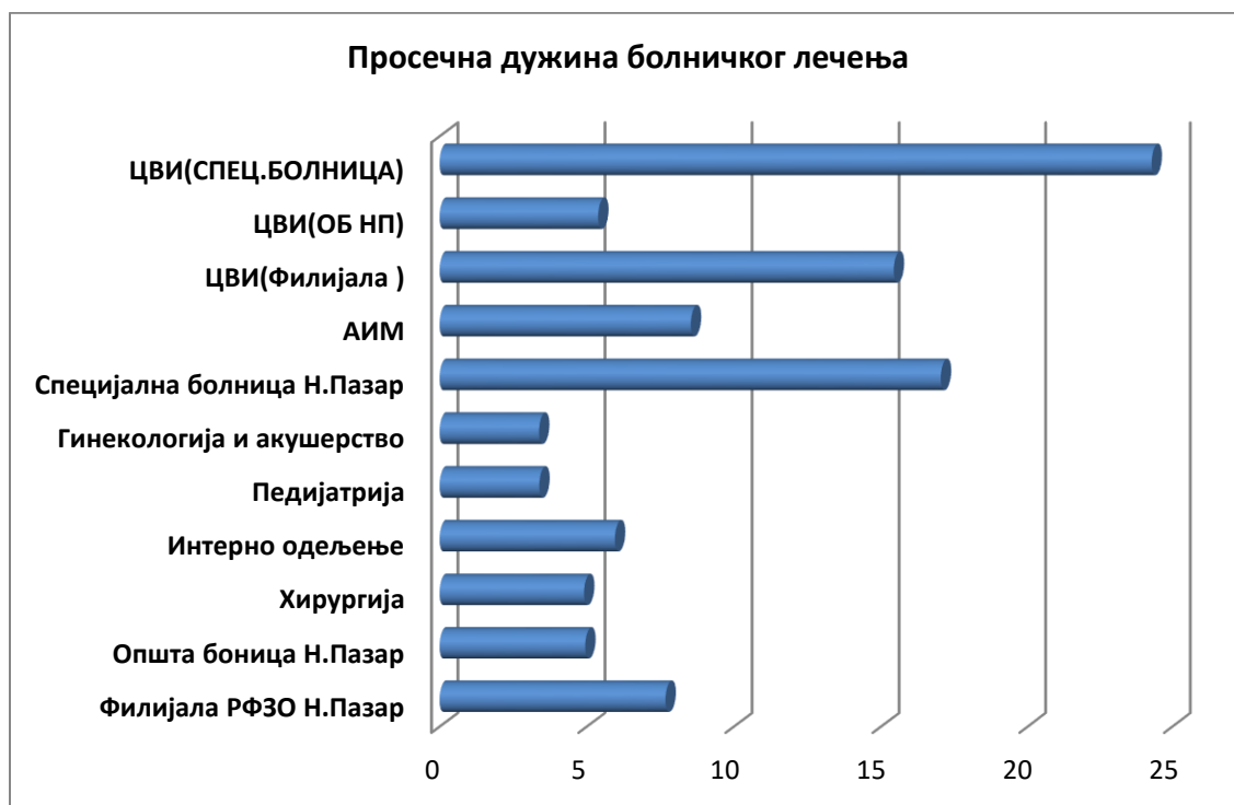
Графикон бр.1-Просечна дужина болничког лечења у 2017.години

Операције се на нивоу Филијале РФЗО Н.Пазар обављају само у ОБ Н.Пазар. У 2017.години обављена је 2694 операција( за трећину више него у прошлој години) где су постоперативно умрла 4 пацијента што даје стопу леталитета 0,15, Један пацијент је после операције добио сепсу тако да је процент умрлих са разлогом постоперативне сепсе 0,04%.